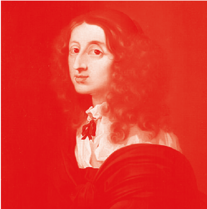
LA REINA CRISTINA DE SUECIA Sebastian Baurdon

Llamada la Minerva del Norte, desde muy joven, Cristina de Suecia demostró tener una sensibilidad e interés por las artes, la filosofía, la teología y la cultura. Subió al trono a la edad de 6 años y empezó a reinar oficialmente a los 18 años. En 1654 abdicó al trono y abandonó Suecia. En el inicio de sus largos viajes, se cortó el cabello, vistió ropas de hombre y viajó bajo el nombre de Conde Dohna. Finalmente se estableció en Roma donde se convertiría al catolicismo. Según los registros, su comportamiento, vestuario y apariencia física era bastante masculina, llegando incluso a decirse que era hermafrodita. Mantuvo una relación muy cercana con Ebba Sparre con quien intercambiaba correspondencia íntima. Considerando que siempre defendió su derecho a no contraer matrimonio y tuvo diversas relaciones cercanas con mujeres, varios investigadores sugieren que Cristina de Suecia era lesbiana.