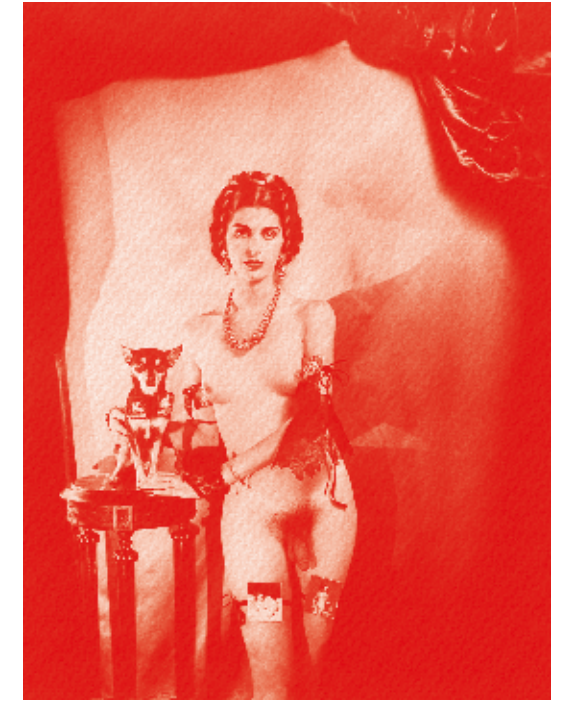
A MAN WITH A DOG Joel-Peter Witkin

Alejandra Bogue es actriz, bailarina y presentadora de televisión mexicana. Inició su trayectoria desde muy joven bailando en centros nocturnos para luego trasladarse al teatro donde participó en importantes representaciones de autores como Bertolt Brecht. Fue musa del fotógrafo Joel-Peter Witkin y se volvió un ícono de la vida nocturna en la Ciudad de México. En 1998 participa en la puesta en escena de Las Criadas de Jean Genet, bajo la dirección de Adriana Roel. Su interpretación de La Señora le valdría el elogio de la crítica obteniendo el premio de Revelación Femenina otorgado por la Asociación Mexicana de Críticos de Teatro. En la televisión ha creado personajes paródicos participando en varios programas como Desde Gayola o ¡Que Show con Alejandra Bogue! . En el año 2010 representa el papel de La Agrado en la adaptación teatral de la película de Pedro Almodóvar, Todo sobre mi madre , obteniendo de nuevo excelentes críticas. Alejandra Bogue se ha transformado en un ícono de la comunidad LGBT en México.