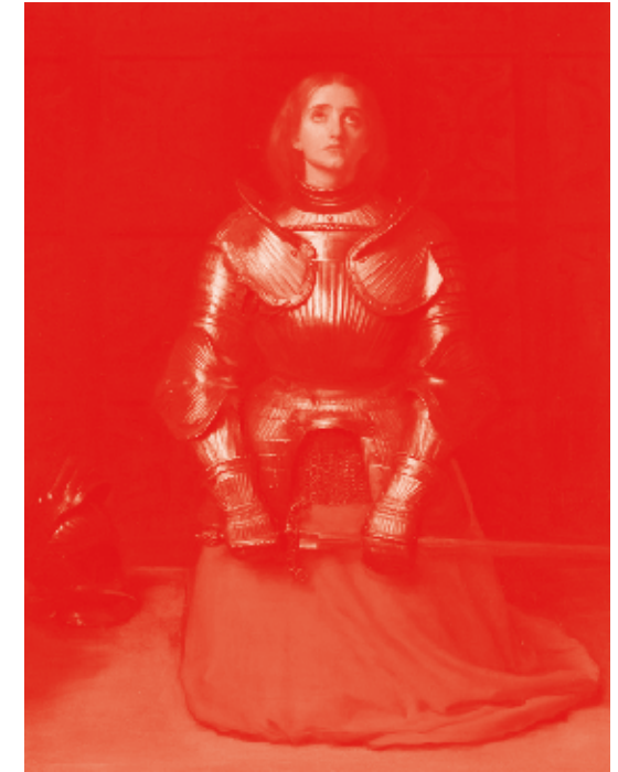
JUANA DE ARCO John Everett Millais